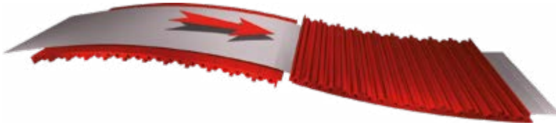
Riscaldamento a vapore All Steam Heating