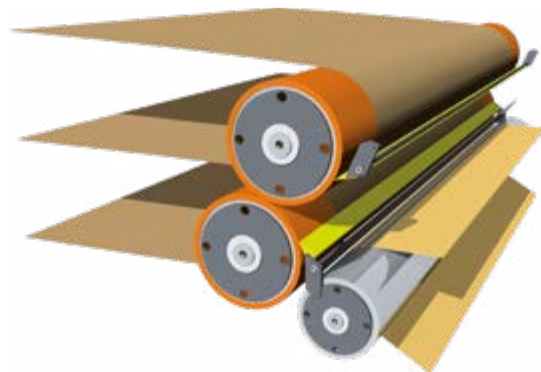
Pressing system 2 rollers