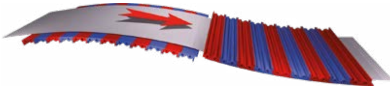
Riscaldamento a vapore ed elettrico Steam & Electric Heating