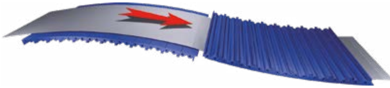
Riscaldamento elettrico All Electric Heating