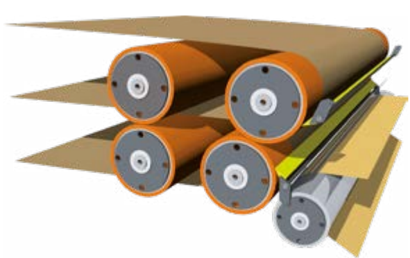
Pressing system 4 rollers

Il sistema di pressatura è composto da 2 o 4 rulli contrapposti gestiti elettronicamente per la regolazione della pressione con lama di distacco sul rullo inferiore e barra silconica sul rullo superiore. The pressing system is made of 2 or 4 silicone covered rollers with electronic pressure control complete with carbonated blade on lower belt and silicone detachable roller for top belt.