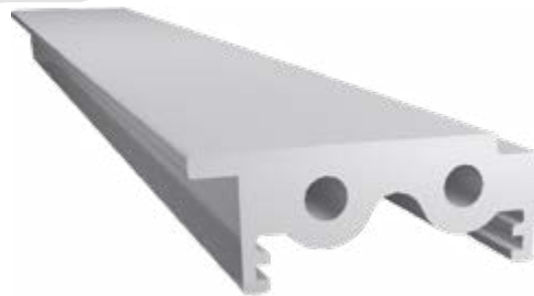
Heating module Modulo Riscaldamento Elettrico o Vapore Electric or Steam Heating System