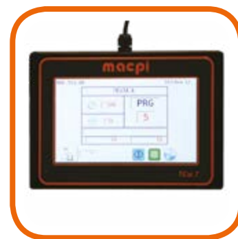
Programmatore Touch screen TCW 7" con USB e Wi-fi totalmente user-friendly grazie ad un display intuitivo e multifunzione. Full color touch screen programmer TCW 7" with USB and Wi-fi, totally user-friendly with a multifunction intuitive display.