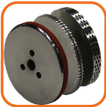
Specific rollers for protective masks.

Ultrasonic machine suitable for fabric cutting, welding or decoration. The unit is complete with analog generator of 28 kHz frequency. Several manual adjustment are available as follows: upper roller pressure and distance, horn and roller speed, horn power. Vertical sonotrode with horizontal roller. Welding seam up to width 10 mm.