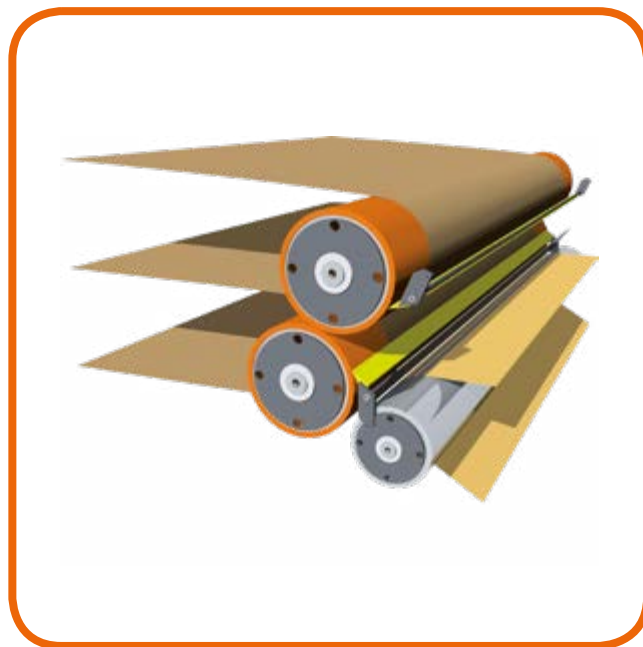
Sistema di pressatura Pressing system

A automatic switch off system will could down and stop the machine at the end of day to improve the lifetime of belt.