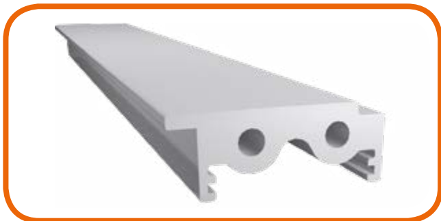
Heating module Modulo Riscaldamento Elettrico Electric Heating System