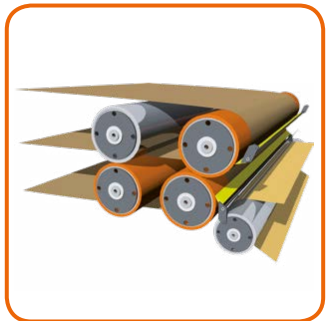
Sistema di pressatura Pressing system

A automatic switch off system will could down and stop the machine at the end of day to improve the lifetime of belt.