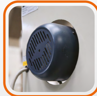
Motore per soffiaggio da 2 Hp 2 Hp motor for strong blowing