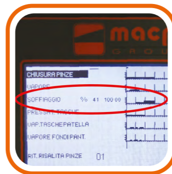
Regolazione quantità soffiaggio con inverter Blowing quantity regulated with in- verter