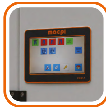
Programmatore touch-screen a colori TCW 7" removibile. TCW 7" removable Full color touch screen programmer