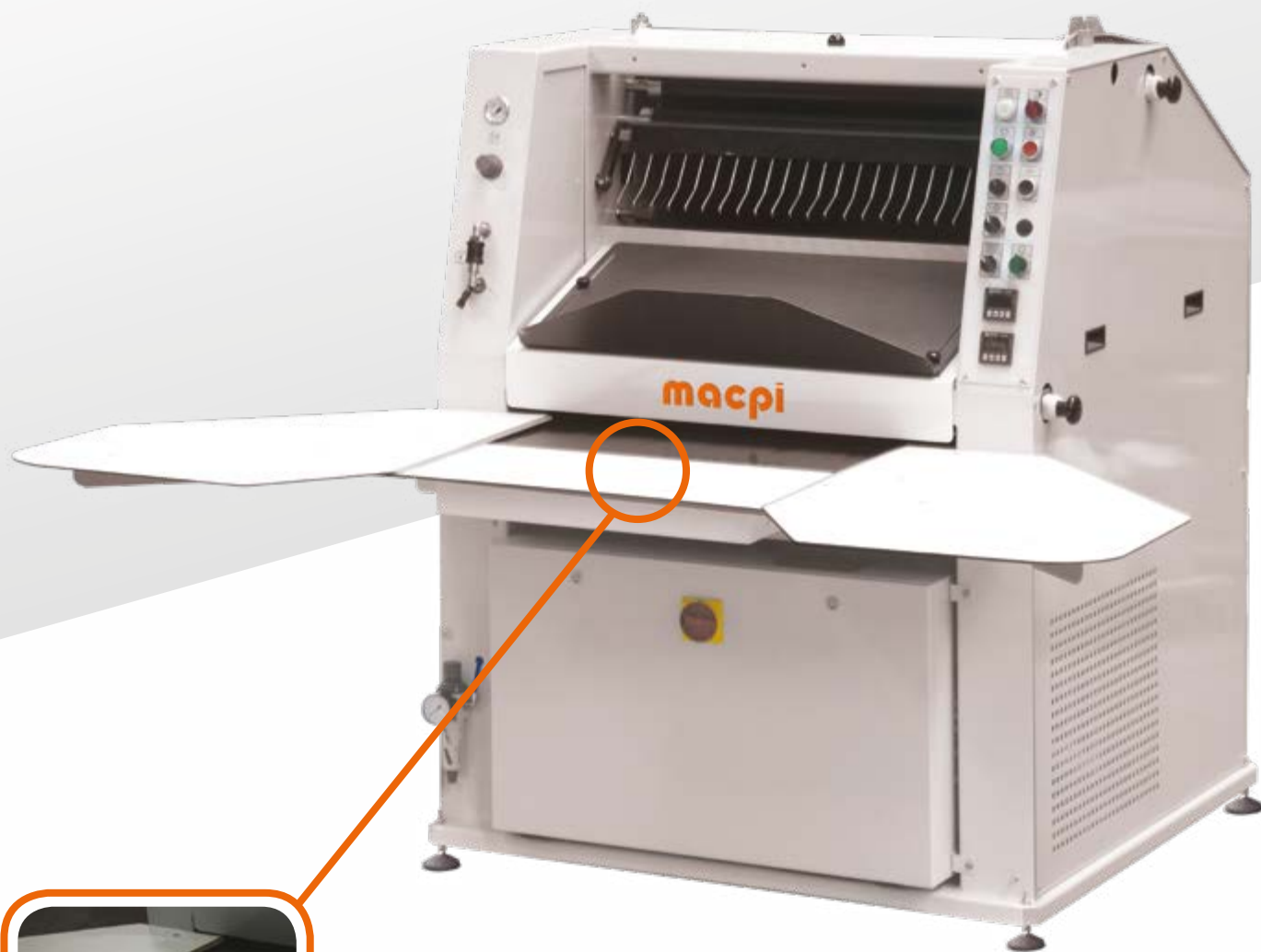
Piano di lavoro Illuminato. Lighting on working area.