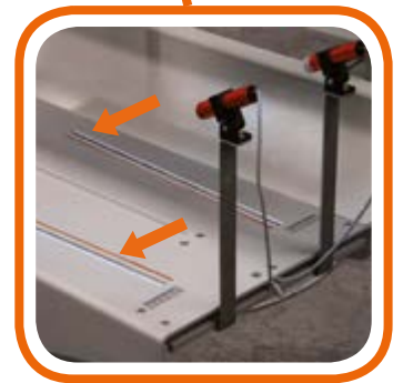
Linee di riferimento per piegatura References for easy folding