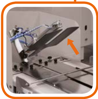
Dime di piegatura Folding templates